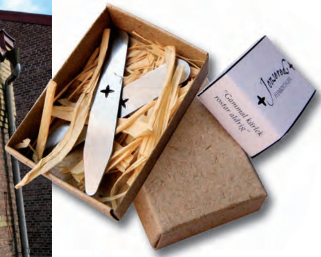
Kraglattor används för att hålla skjortkragens snibbar styva. Ibland finns lattor av plast insydda i kragen, medan finare skjortor har fickor på baksidan för lösa lattor.