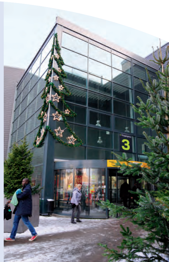
Julstämning i Allum. Handeln i Partille kommun ökade med hela 10% förra året.

Kulturum har blivit en mötesplats för kultur och utbildning. Precis som det var tänkt. Kommunen fortsätter nu att utveckla samarbetet för att ytterligare förstärka Porthällagymnasiets attraktivitet. Huset kommer att byggas till så att vi kan samla fler utbildningsverksamheter, och utöka samarbetet med högskola, grundskola, studieförbund och näringsliv.