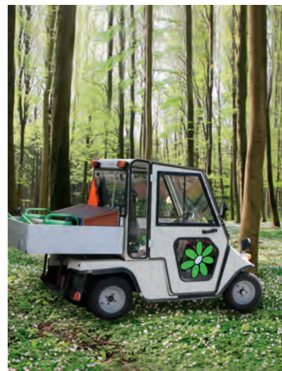
Fotot på elbilen ingår i Partillebos miljökampanj som kan ses i anslutning till vissa bostadsområden.

Här hittar du också en illustration som visar hur kretsloppet fungerar i Partille.